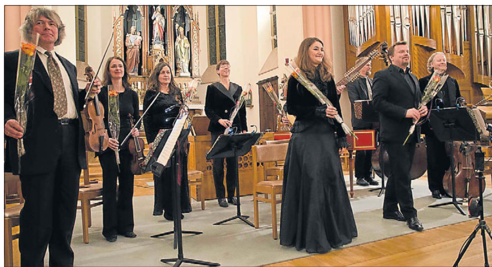
Une élévation spirituelle à la fois religieuse et respectueuse de l'idiome et de la sensibilité baroques.

La très forte suggestivité de la mère affligée sous la croix connut une heureuse mise en perspective en faisant précéder l'œuvre culte de Pergolèse de la vision plus archaïque de Giovanni Felice Sances, mettant en valeur ainsi l'apport expressif des techniques relevant de l'opéra seria dans une œuvre religieuse. Il est clair que, pour nos oreilles modernes, une telle mise en abyme tourne rarement à l'avantage des mélismes dépouillés de l'Ars Antiqua. Aussi est-ce au niveau de l'expression des sentiments que le Stabat Mater de Pergolesi pose des difficultés d'interprétation majeures: un vibrato trop soutenu ou un dolorisme trop extraverti et on bascule dans l'opéra; à l'inverse, un excès de détachement dans l'affect ou d'austérité dans les couleurs prive l'œuvre de la puissance émo-